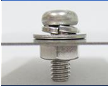
一般的な座金組込ねじ